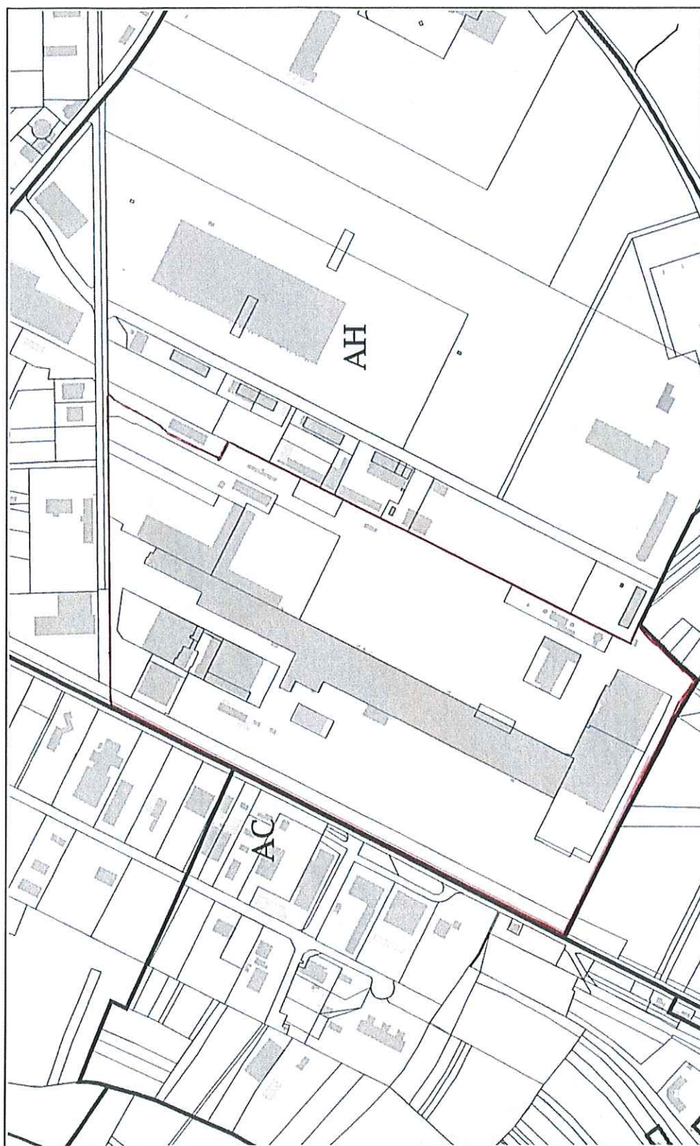
Carte de localisation des servitudes particulières liées aux zones identifiées à pollutions résiduelles